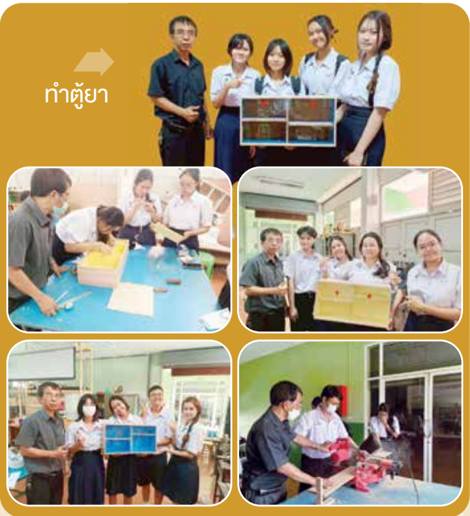
ทำตุ๊กตา