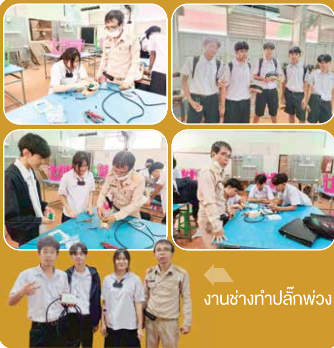
← งานช่างทำปลั๊กพ่วง