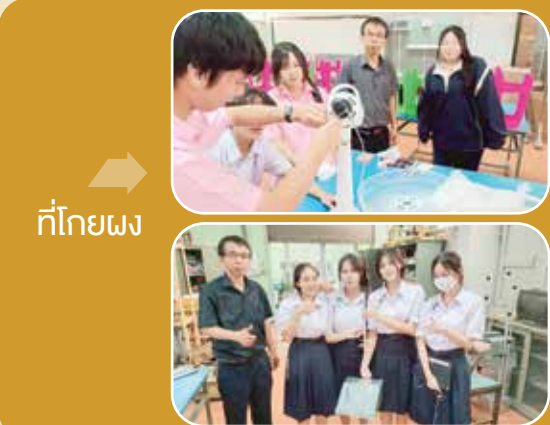
ทำโถยพวง