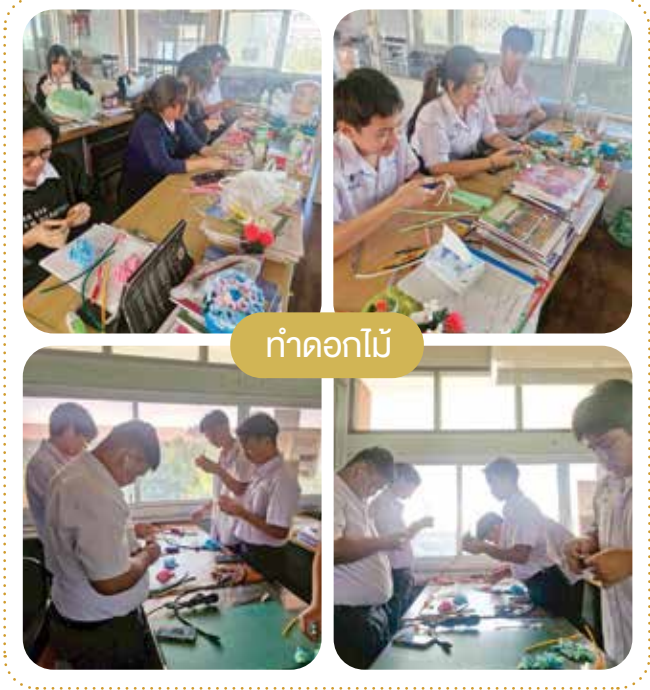
ทำดอกไม้